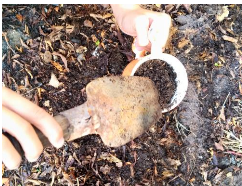
3. 用閒置的杯子裝土