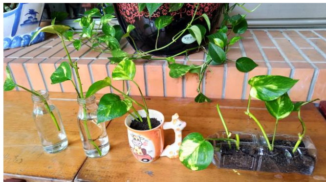
4. 廢棄玻璃瓶、寶特瓶亦可裝土，成為窗邊、洗手台或廁所的一幅美景！